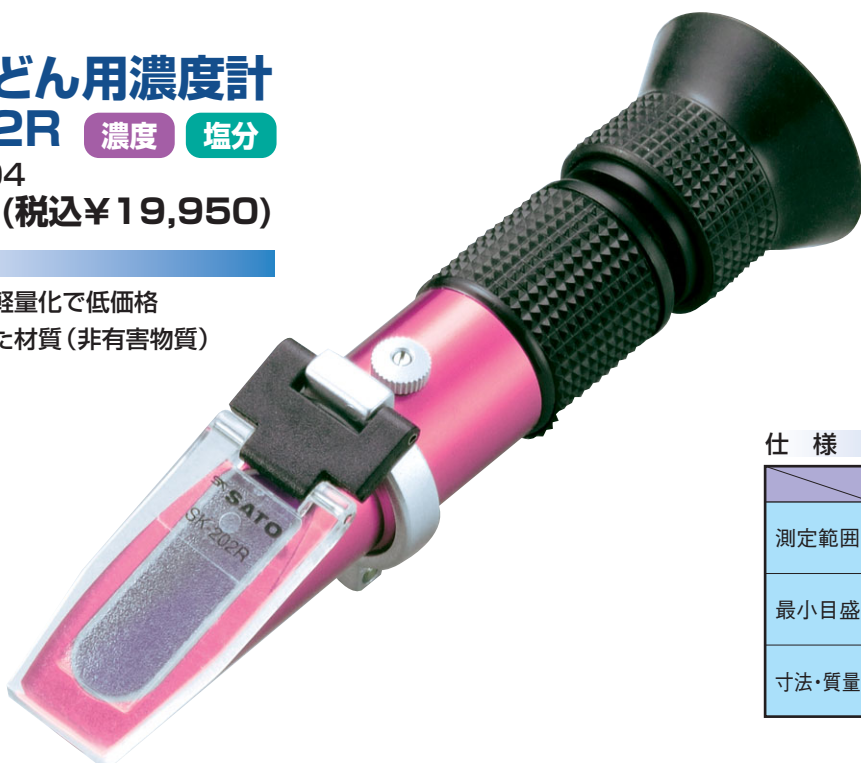
そば・うどん用濃度計目盛