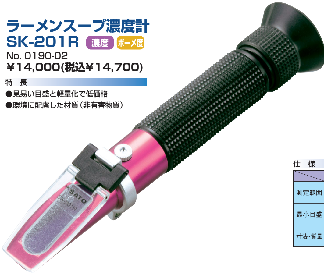
ラーメンスープ濃度計目盛